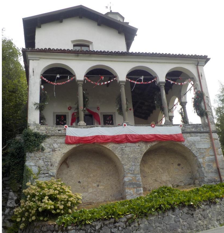
Chapelle de San Rocco. Elle est prête pour le 15 août.