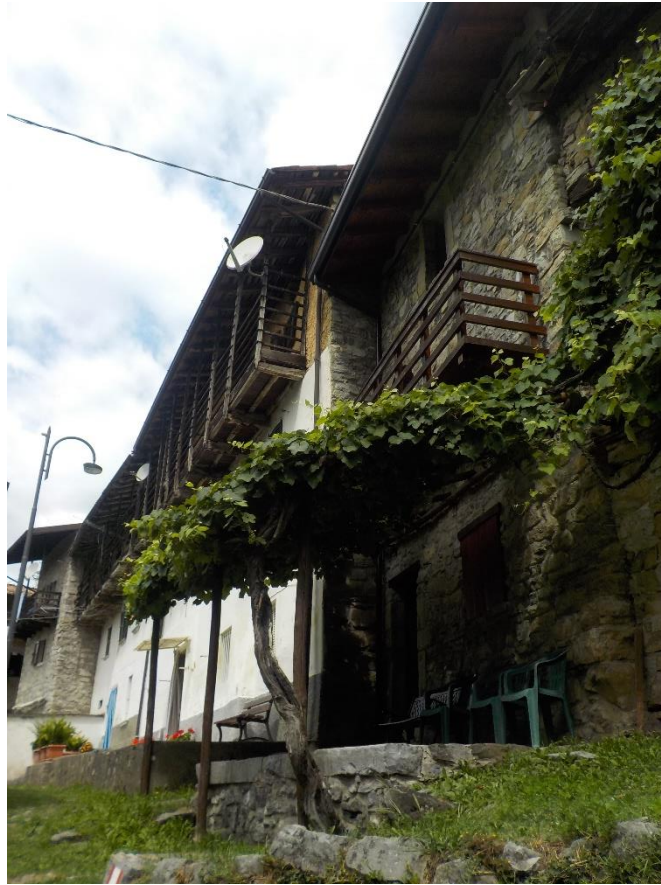
Bout du hameau et déjà en route pour Bosco Fuori.