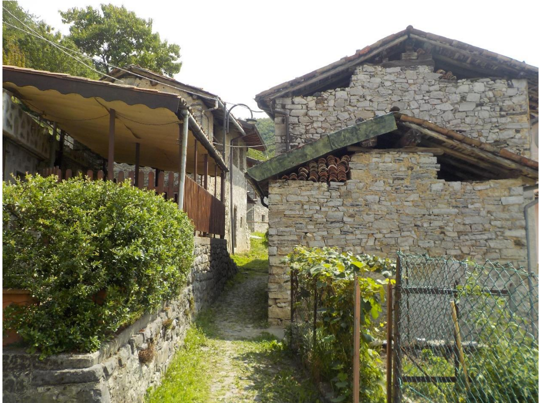
Maisons de pierre abandonnées par les habitants d'origine, rachetée par des vacanciers.