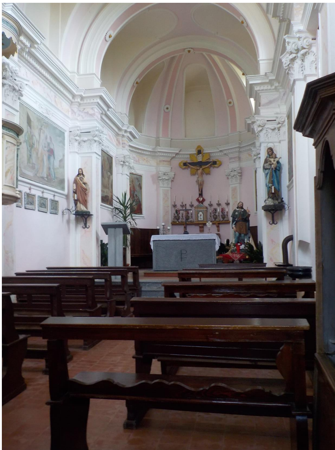
La chapelle comme d'habitude est fermée. Photo prise aussi comme d'habitude aussi par le grillage de l'une des deux fenêtres de la façade principale.