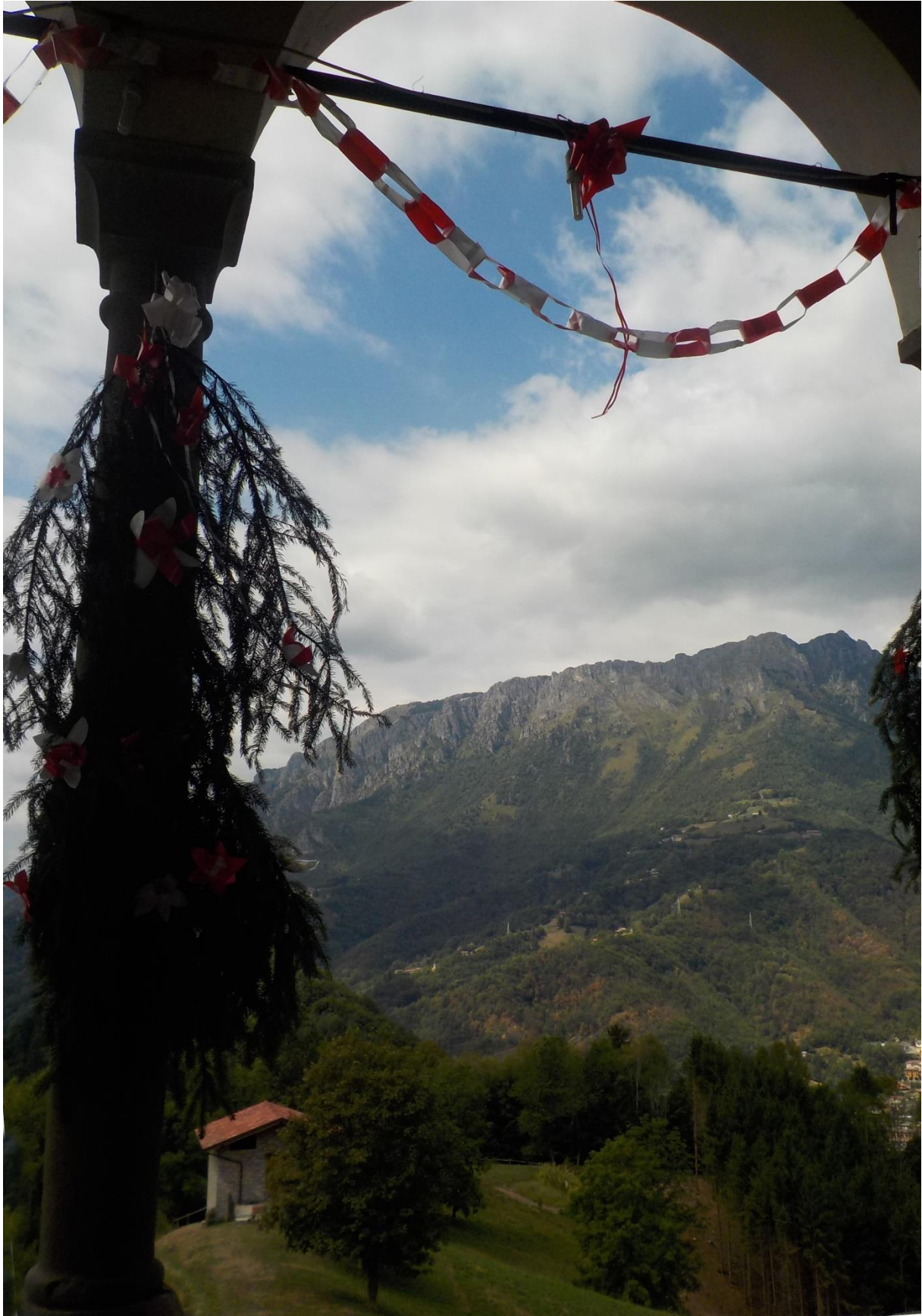
A vos pied une part modeste du Val Brembana.