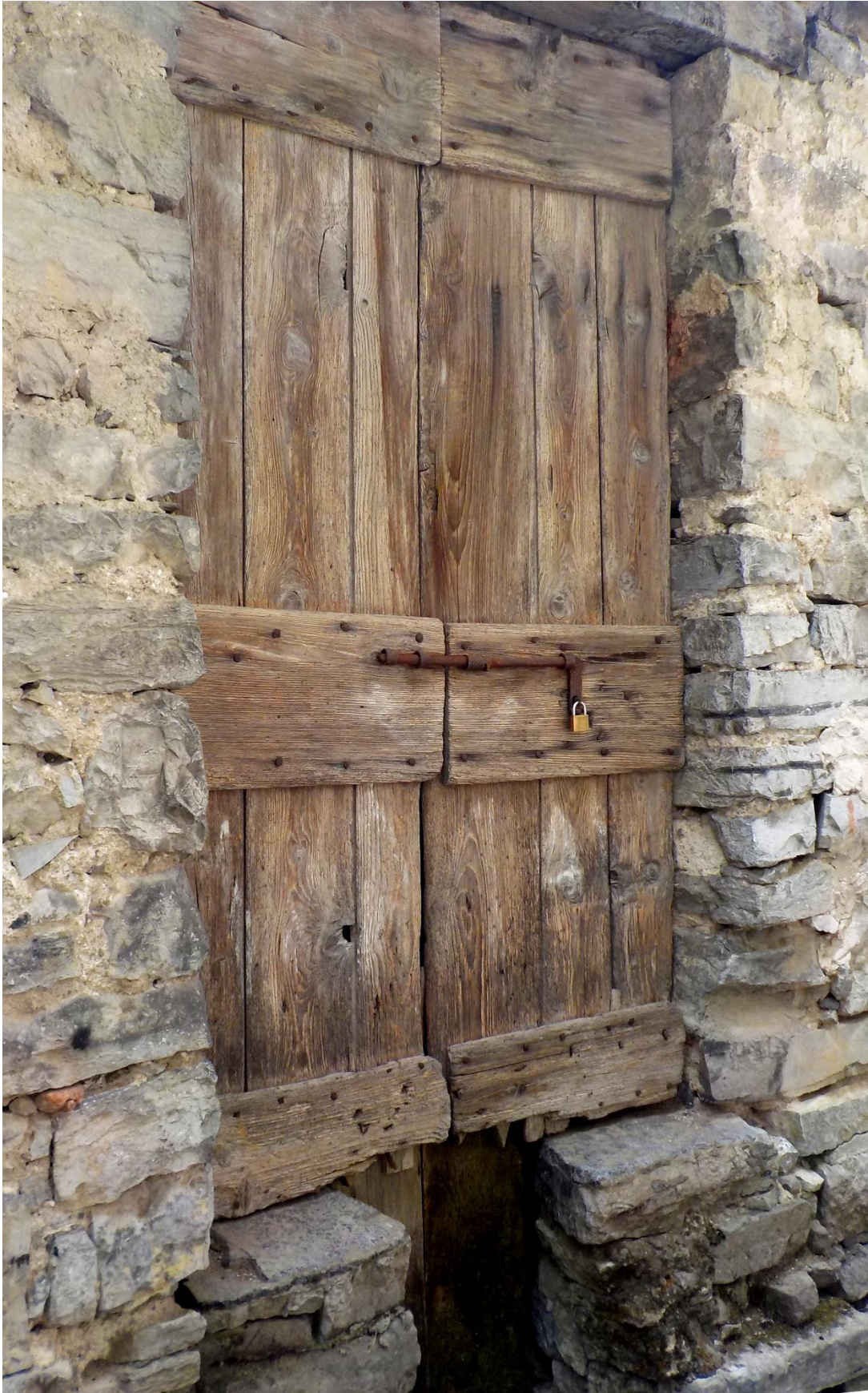
On redécouvre l'une de ces bonnes vieilles portes de grange, avec ici le bas qui manque à l'appel !