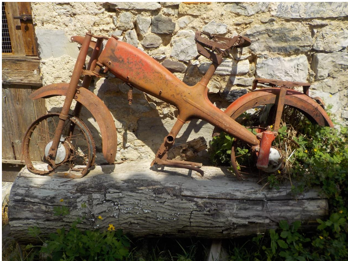
Celle-là a sans doute roulé sur les chemins avant qu'il n'y ait de véritables routes d'accès. Elle témoigne d'une manière parfaite d'une période d'entre deux mondes.