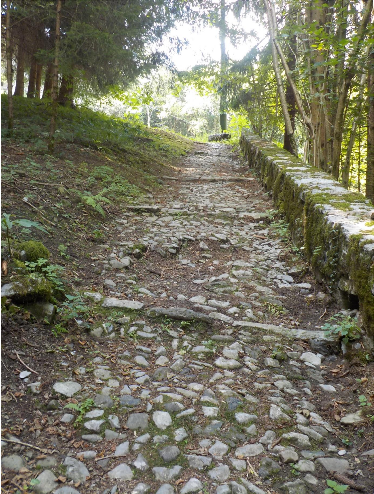
Un sentier de mulet nous y mènera.