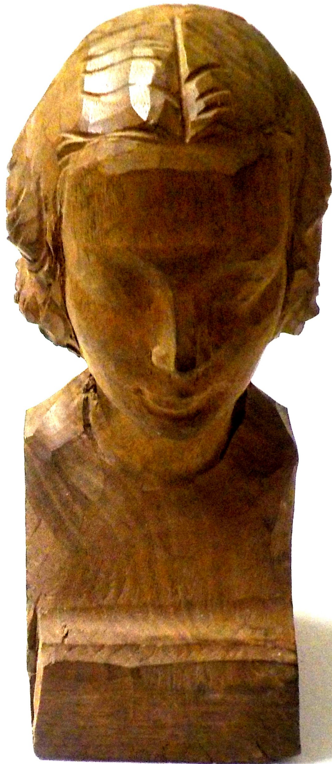
Tête de jeune fille, bois.