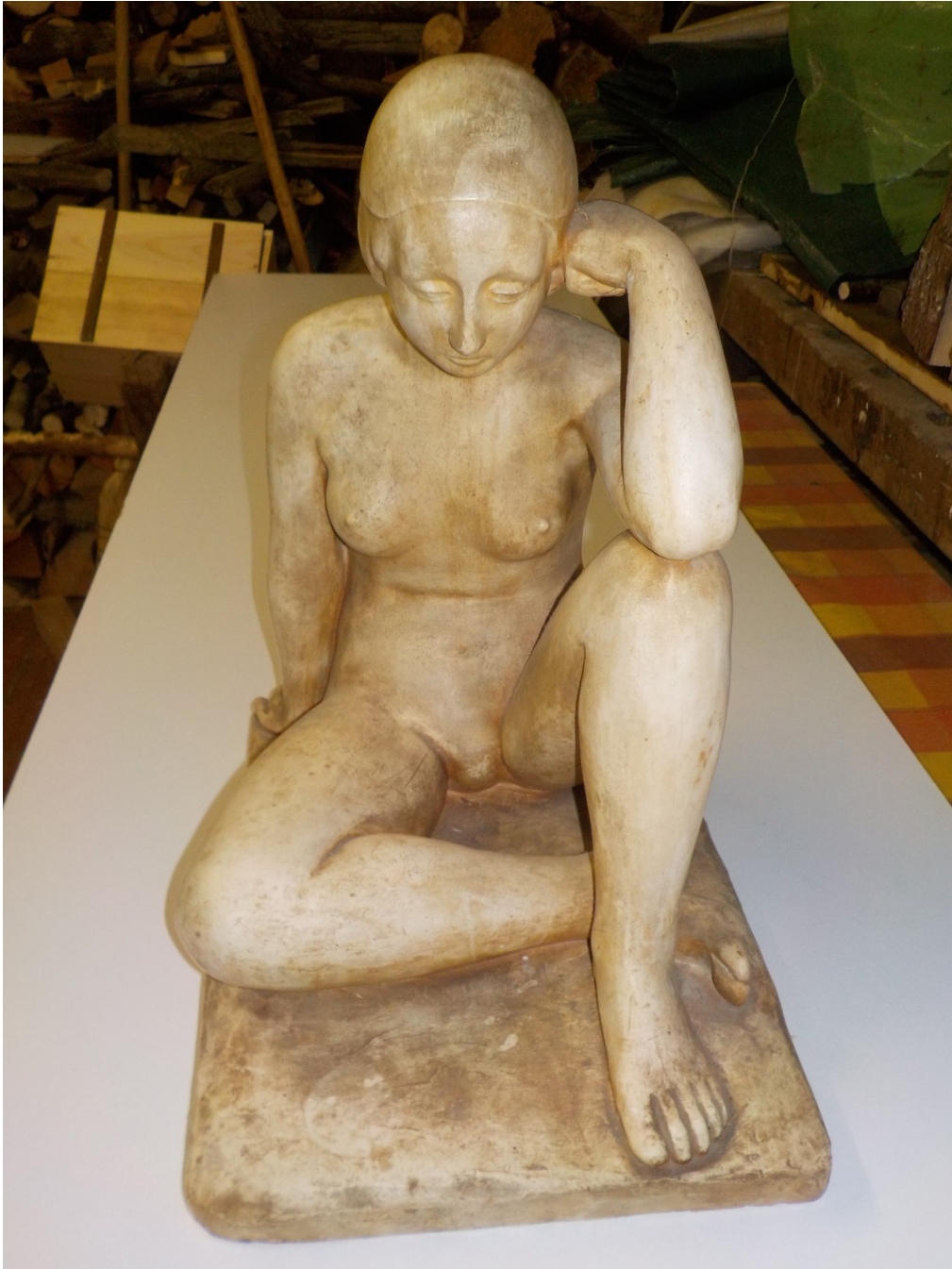
Sa grande œuvre, « Jeune fille en pensée profonde » ! Plâtre

Au final notre artiste ne devait nous livrer qu'un matériel sans grand intérêt et surtout fort encombrant.