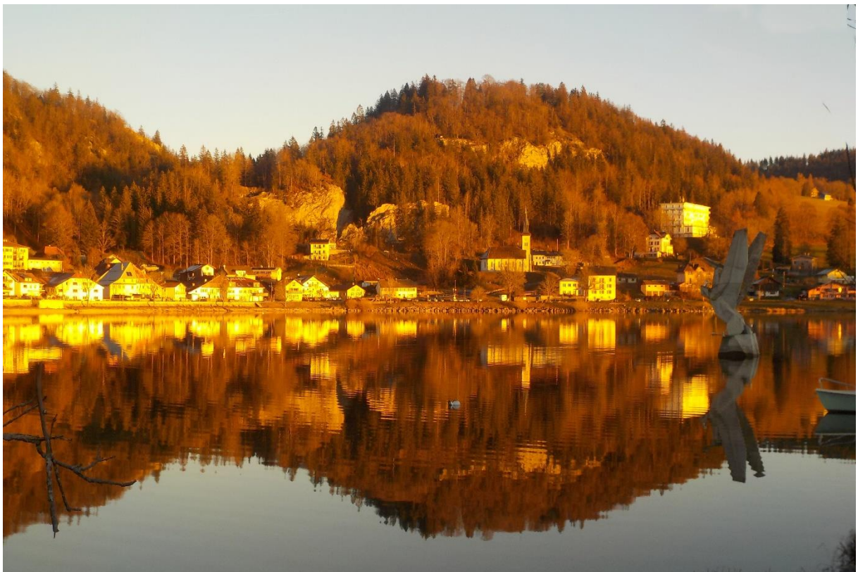
Pégase ne vous fâchera sans doute pas !