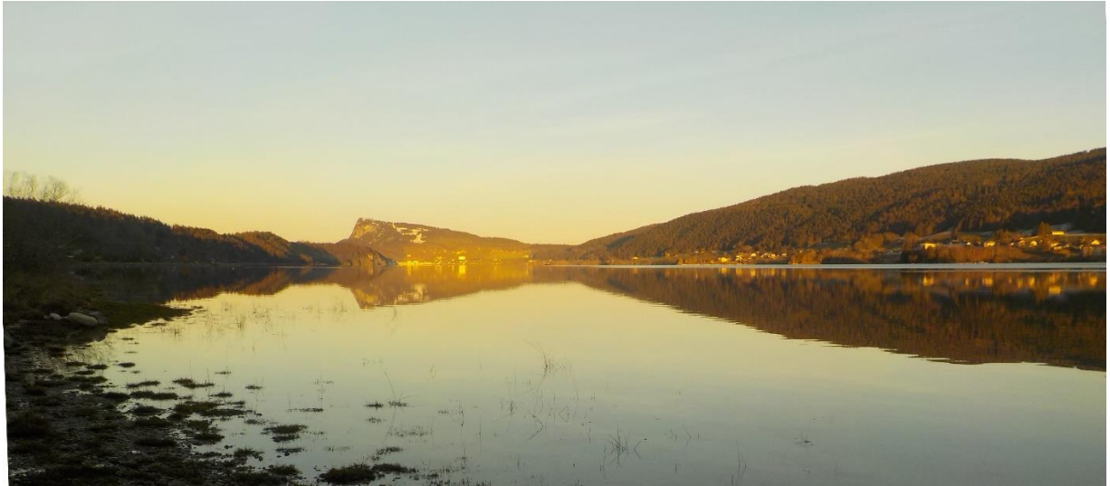
Fin de dimanche à l'autre bout.