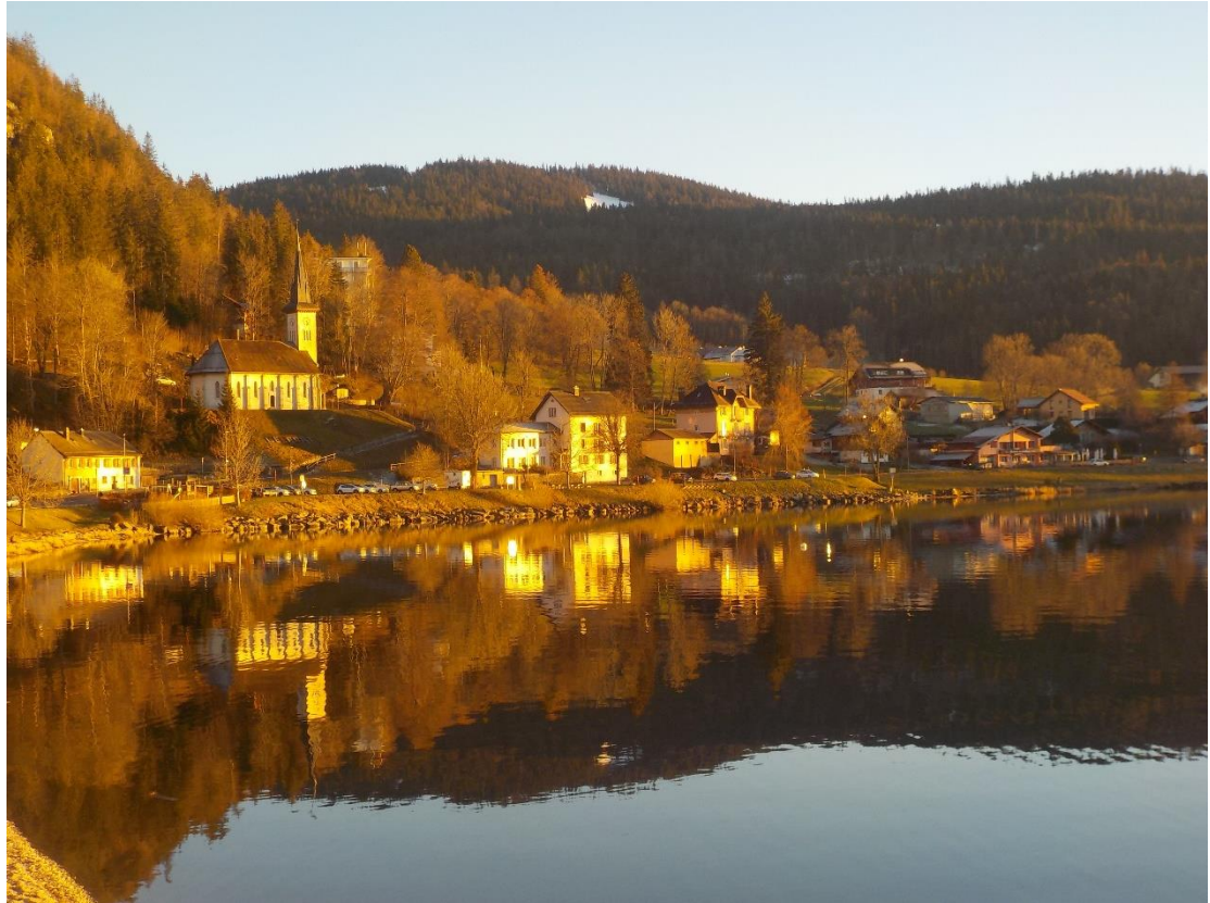
Le Pont, un village qui se dore aux derniers rayons du soleil de décembre.