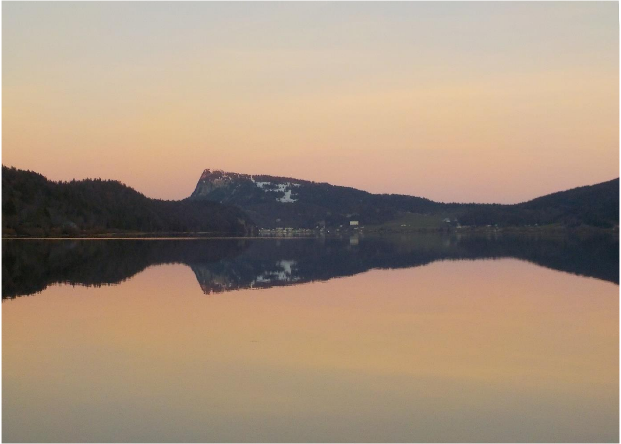
Ni le Rocheray non plus.