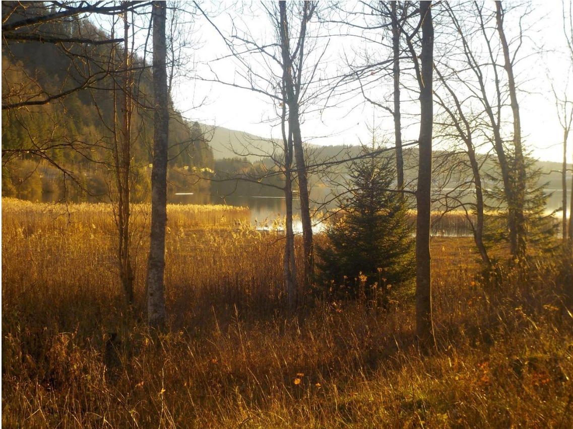
C'est à la Tornaz et c'est singulièrement romantique.