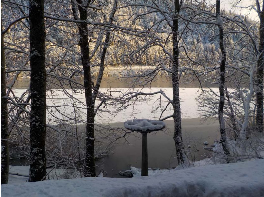
Technique et paysage.