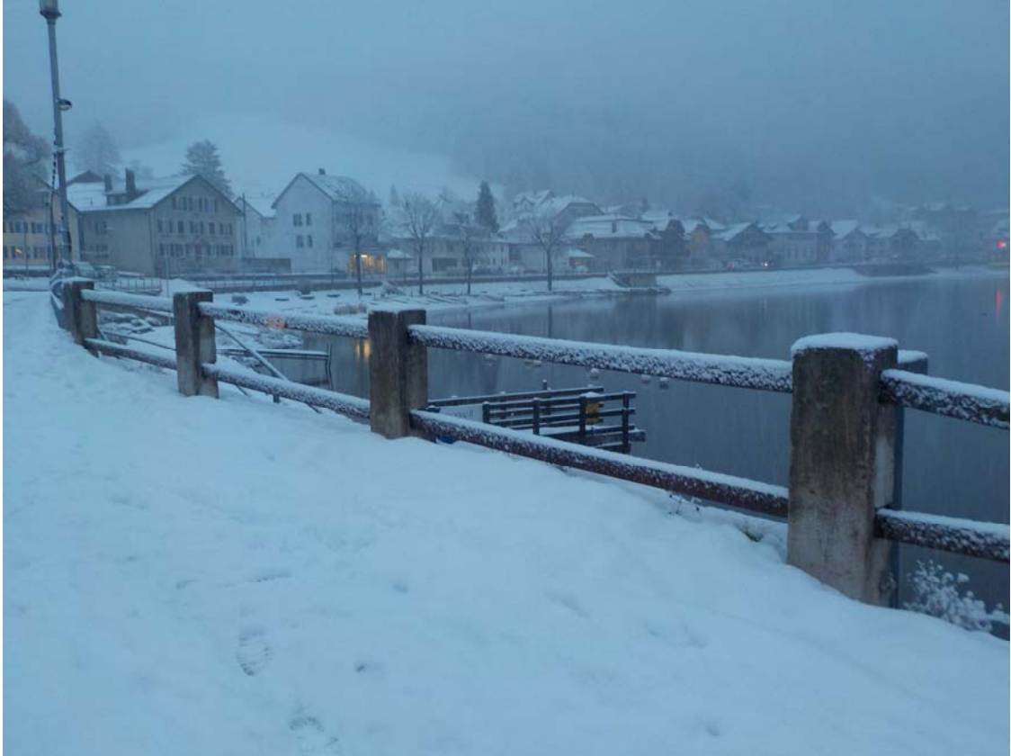
Le Pont s'endort sous la neige.