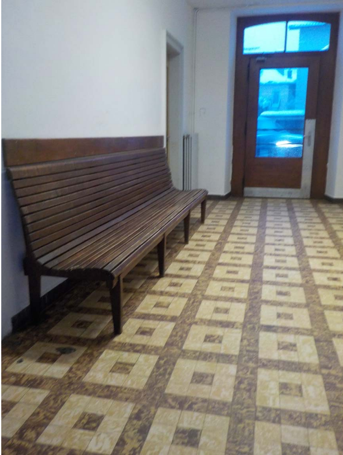
Un jour vous trouverez qu'il s'agit-là d'une photo historique !