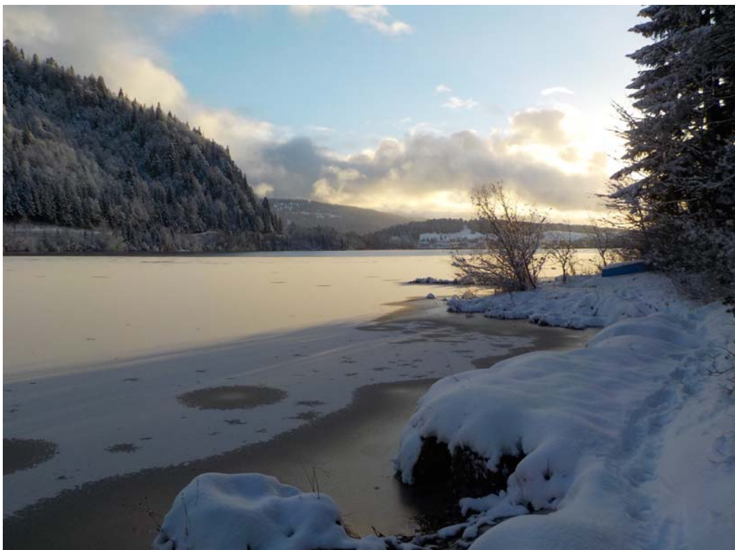
Un coin que les peintres affectionnent. Le lac a cremer, que l'on dit, c'est-à-dire qu'on a vu une fine couche de glace le recouvrir. Ici c'est pourtant tout à fait local. Par place, dira-t-on.