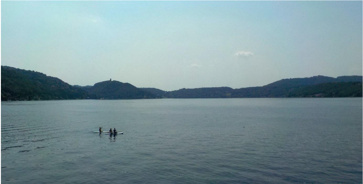
Un lac pour vous seuls...