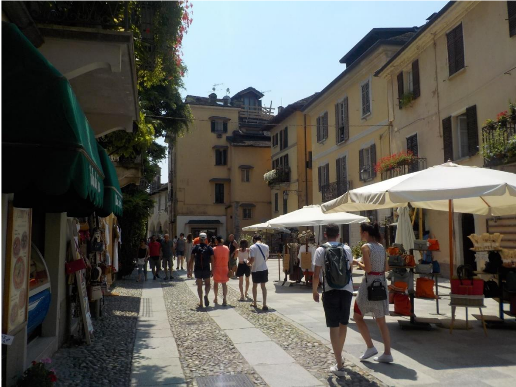
Une rue principale au bord du lac et des ruelles perpendiculaires qui grimpent déjà la colline, telle est Orta.