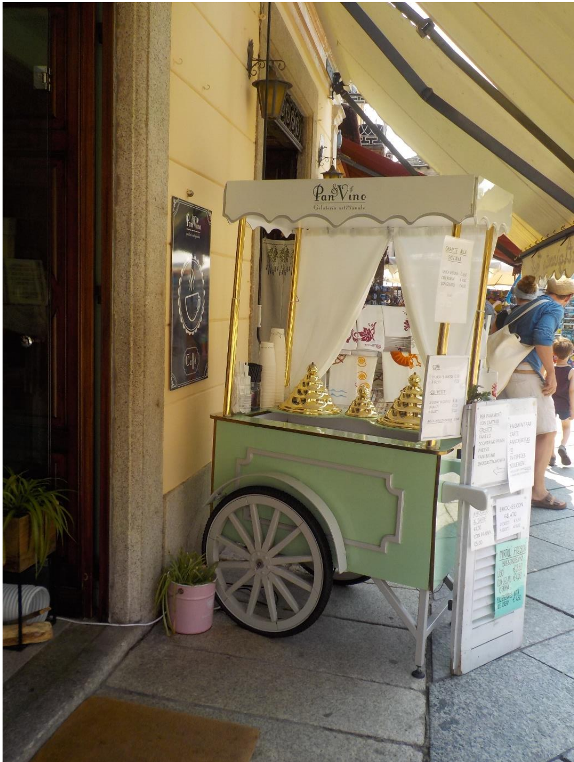
Il fut un temps ou les soft-ice étaient de rigueur.