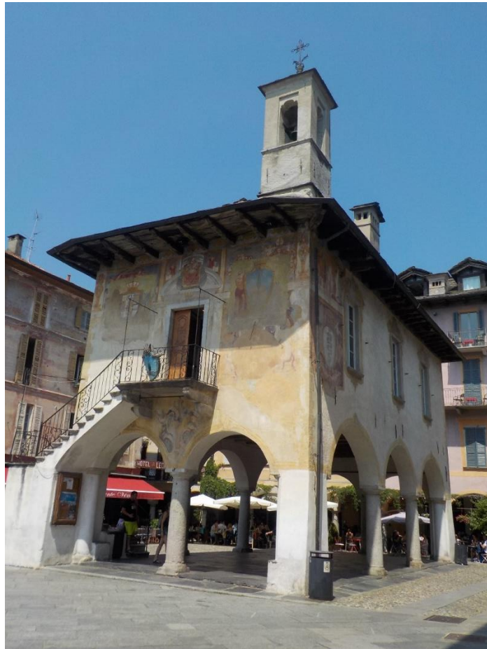
Et en bordure de la place ce bâtiment ancien très caractéristique en même temps qu'intrigant.