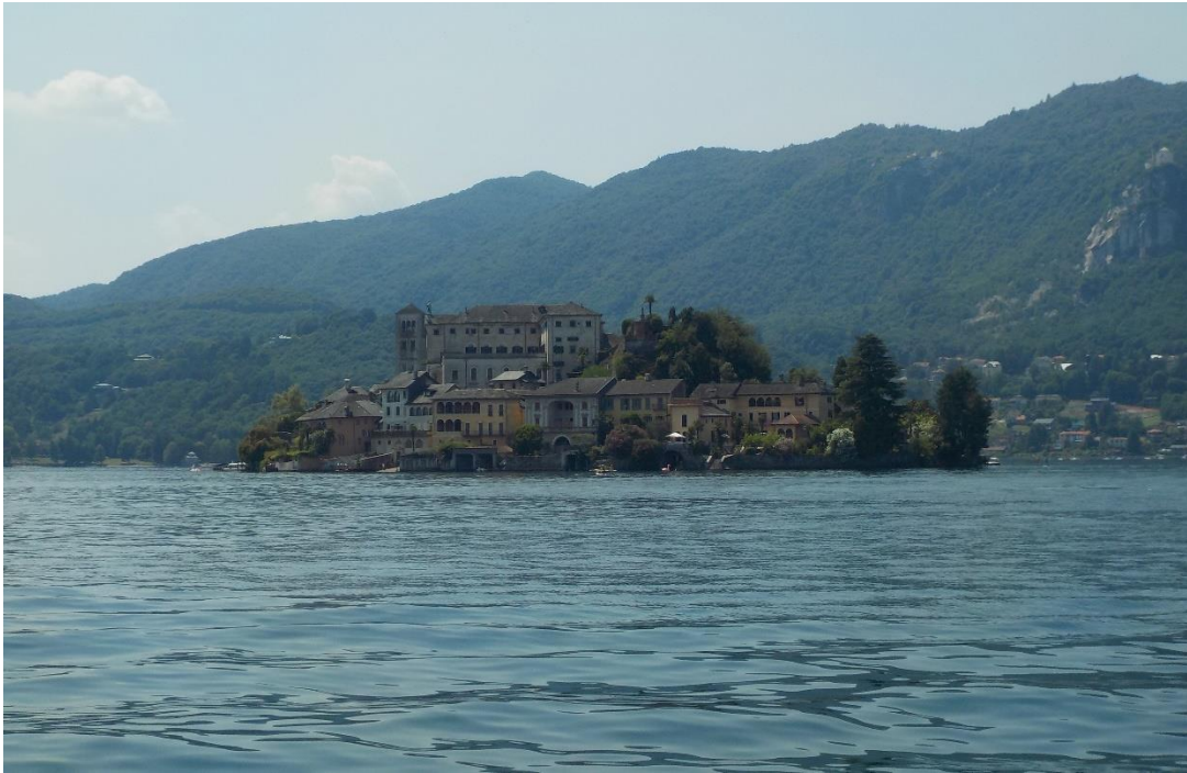
San Giulio, au milieu du lac.