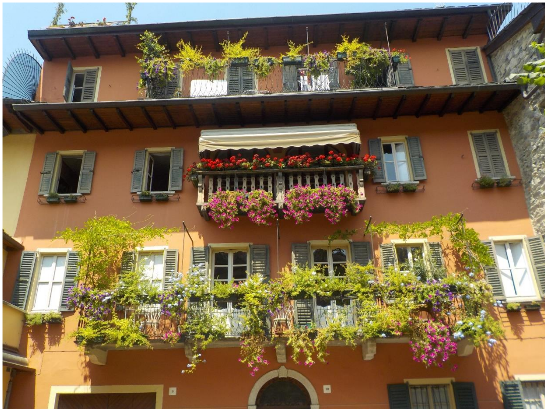
Et une jolie maison dont les habitants aiment les fleurs et la verdure...