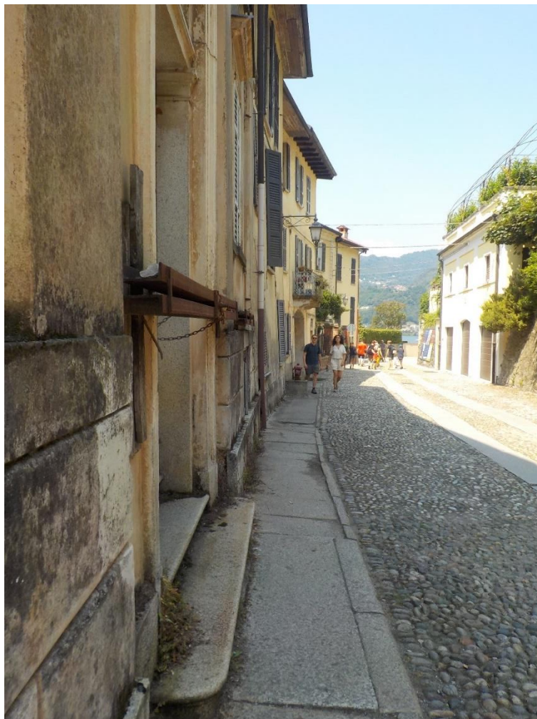
Orta nous accueille par un joli trou dans le trottoir !