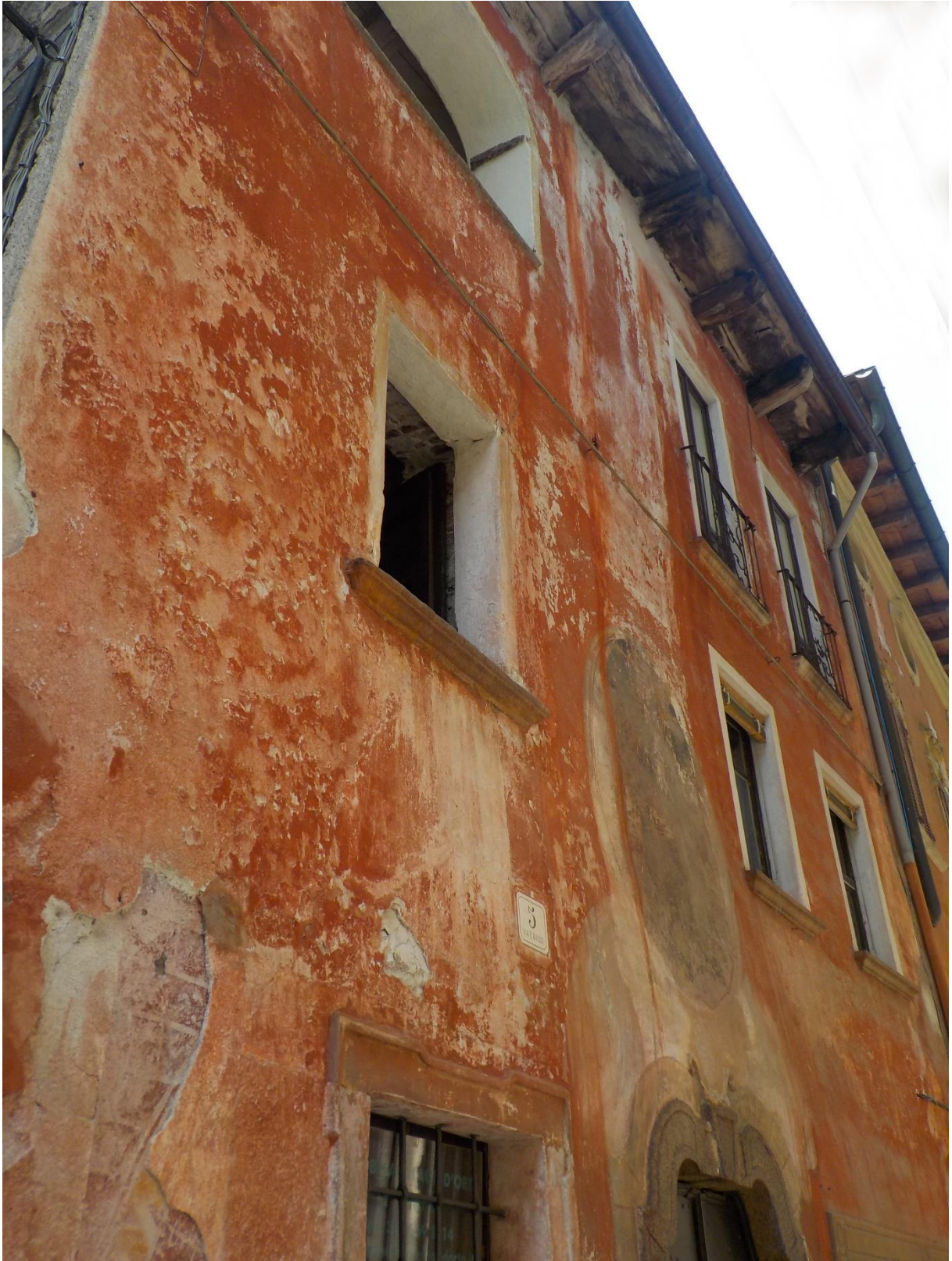
Les couleurs du sud...