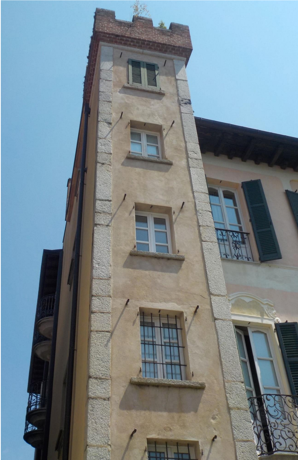
Des constructions étonnantes.