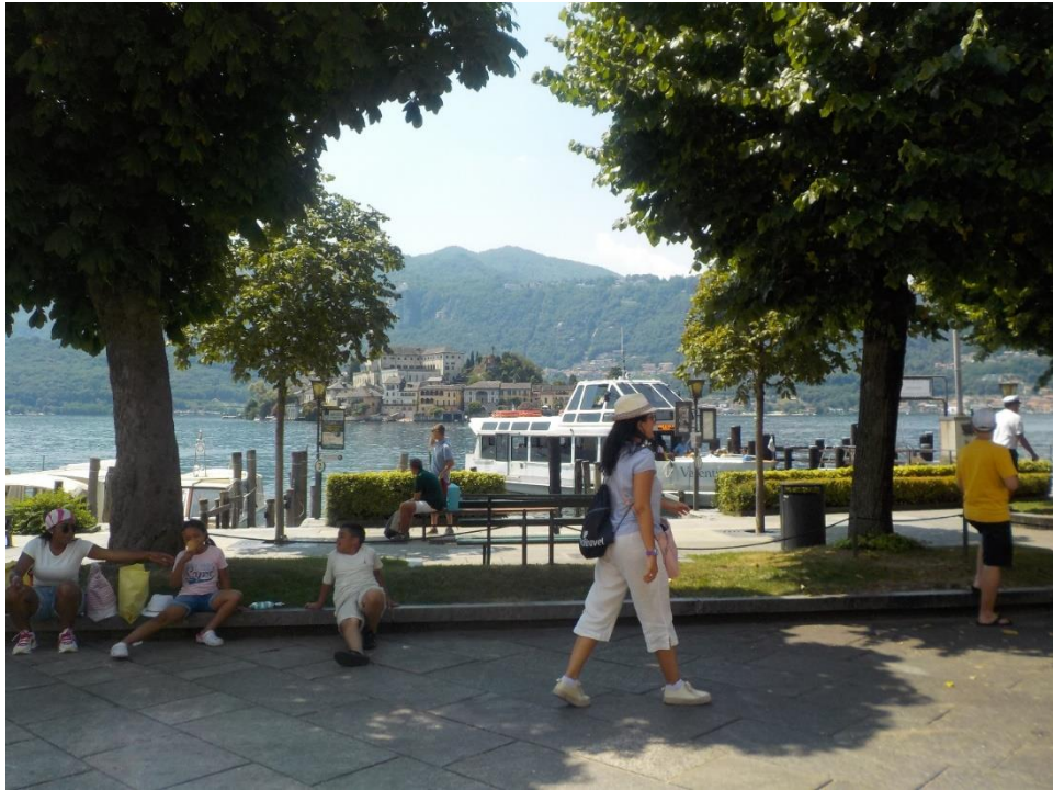
Au loin l'île de San Giulio