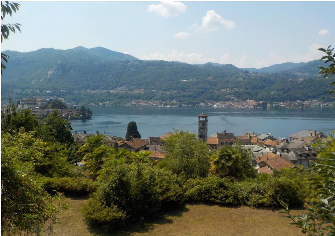
Le bourg d'Orta vu depuis la colline.

Des bâtisses sur lesquelles on ne peut que s'interroger. De quelle époque, construites par qui, quels en sont le ou les propriétaires actuels, modernes et confortables ou encore avec le côté primitif de l'ancien ?