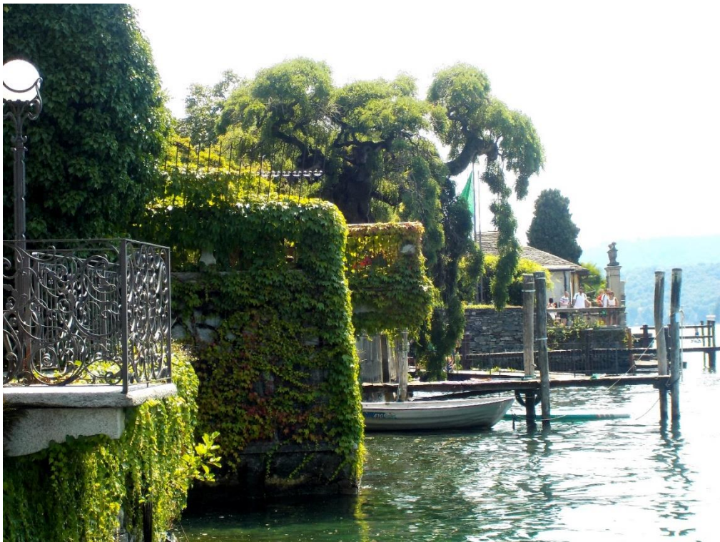
Quand la propriété privée empiète sur le lac.