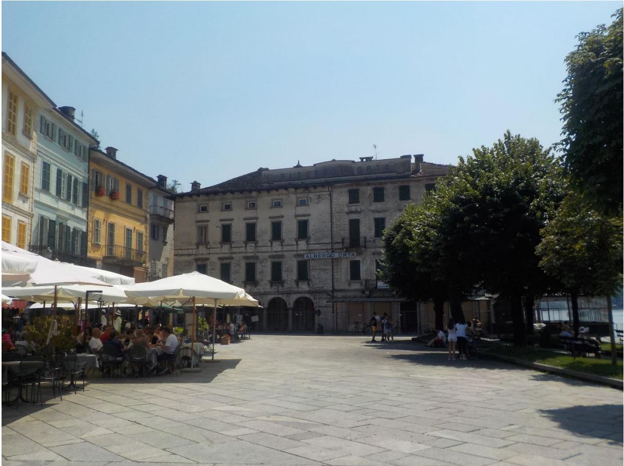
Des bâtiments administratifs de belle importance et un quai couru des visiteurs.