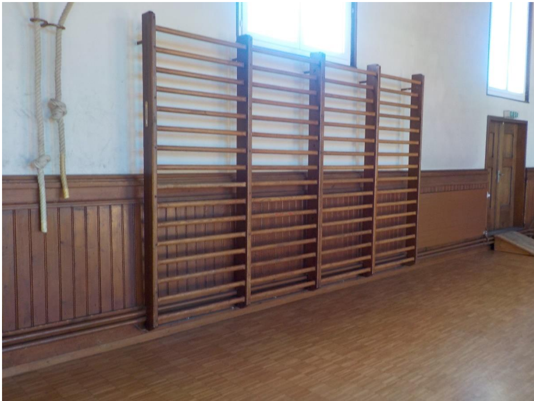
Ces fameux espaliers.