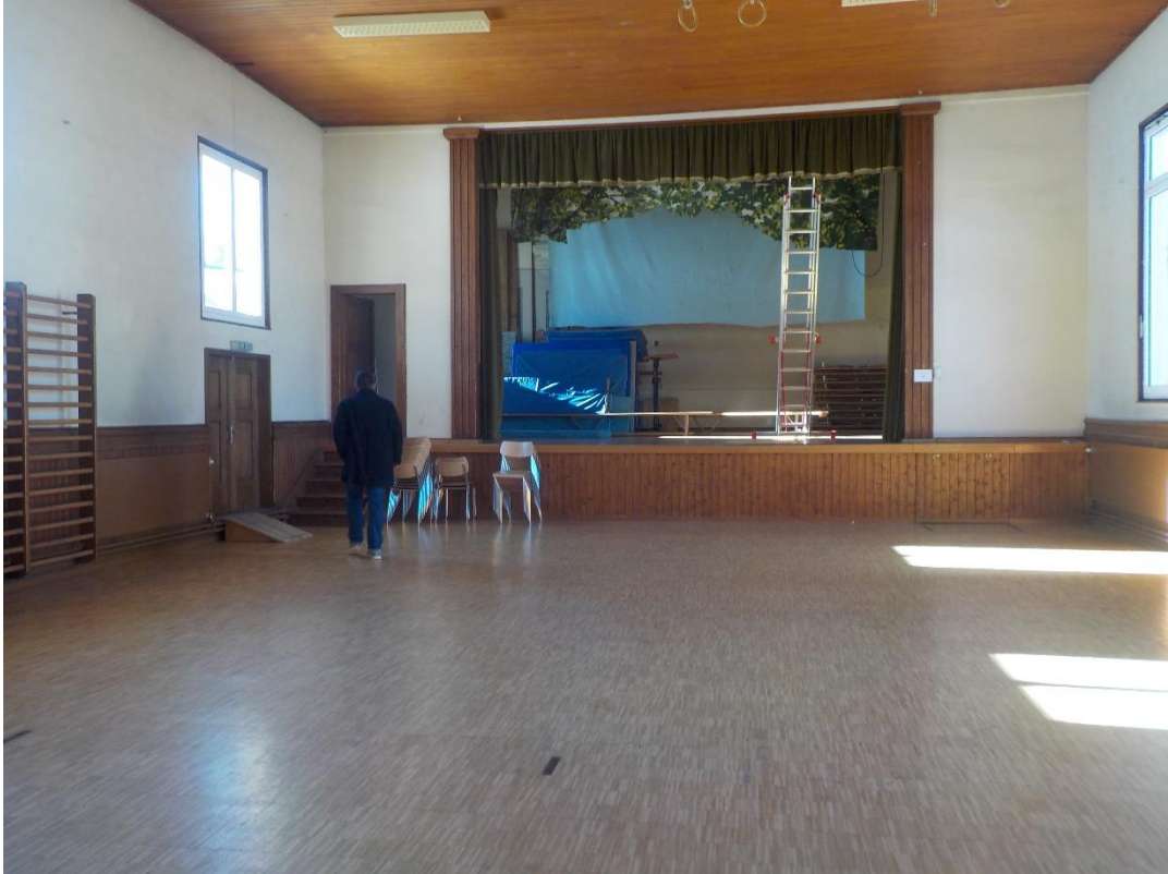
Une grande salle qui n'accueillera plus personne désormais.