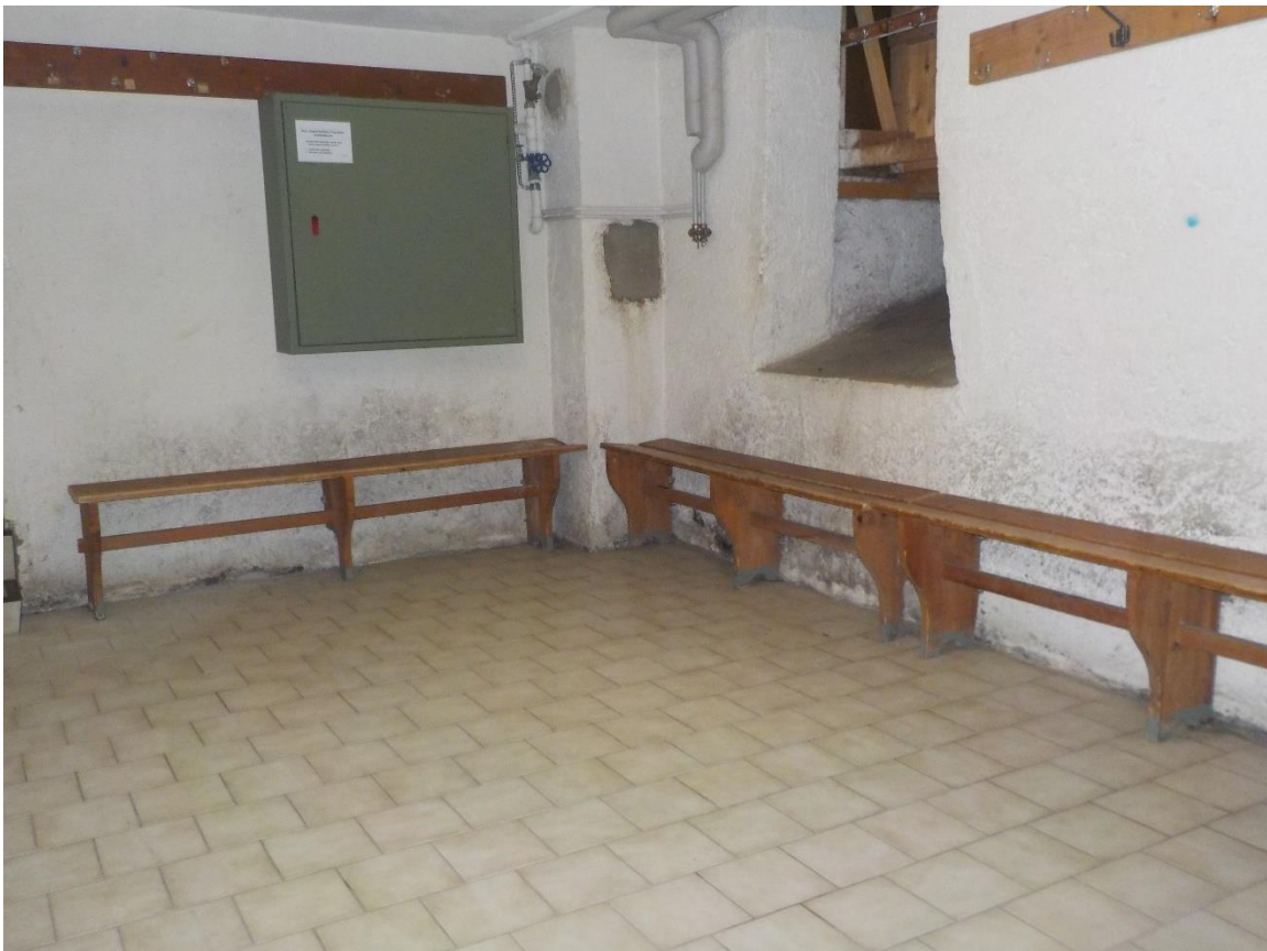
Vestiaires des douches. Tout ça n'a pas la grande forme !