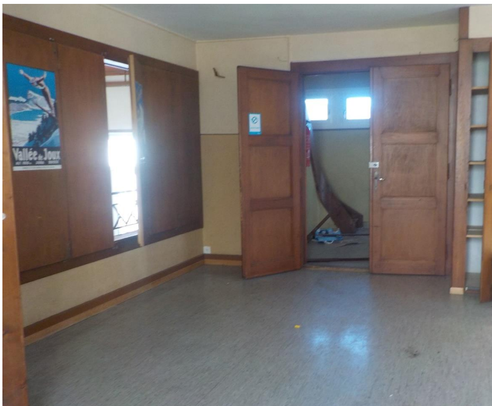
Petite salle du haut, réservée à la couture de ces dames et aux assemblées du Conseil général.