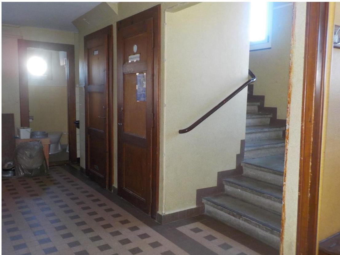
Hall d'entrée et escaliers pour l'étage.