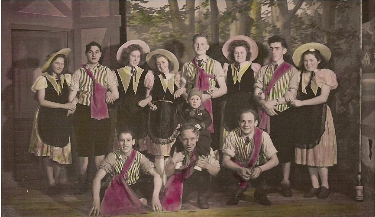
De beaux lurons et de belles luronnes!