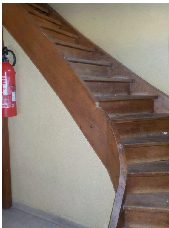
L'escalier conduisant à l'appartement du concierge et du galetas. Le tout étant dans un état misérable, on se passera de s'y rendre !