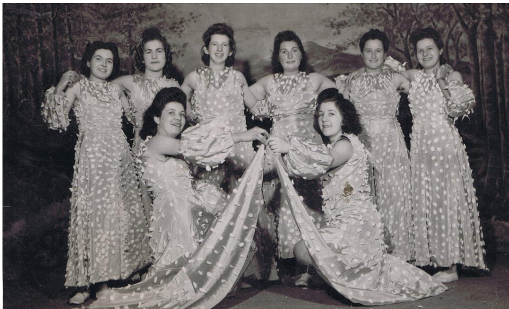
Elles jouaient les élégantes.

Le projet, un peu trop compliqué, resta dans les tiroirs pour ressortir pas loin d'une décennie plus tard, en 1937, désormais amputé de la poste. La construction serait assurée par une société qui remettrait un jour le bâtiment franc de dettes au village. Architecte Cerrutti de Cossonay-Gare. Le 5 octobre de cette année-là avait lieu le procès-verbal de la fondation de l'Association pour la construction et l'exploitation du local des Charbonnières. Une convention était signée quelques jours plus tard entre cette Association et le village lui-même pour le financement et l'exploitation du nouveau bâtiment qui serait construit en 1938.