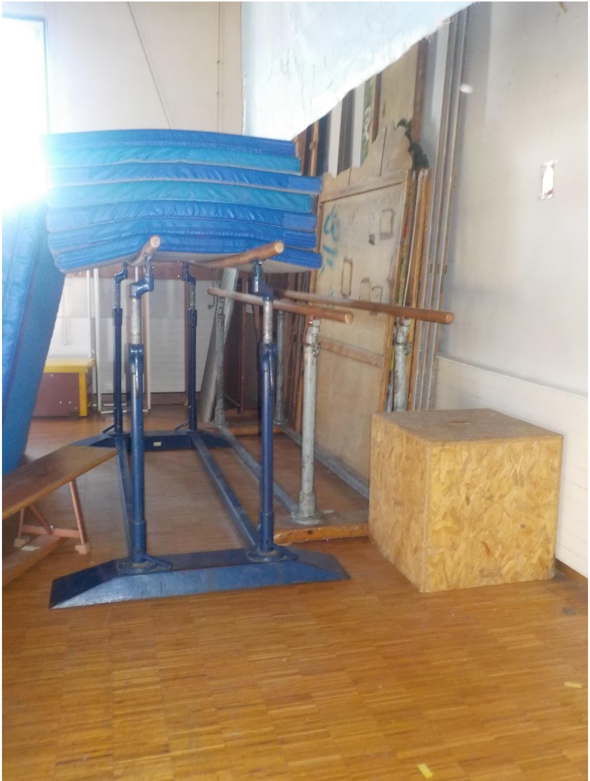
Scène, barres parallèle et décors. On en sauvera une partie.