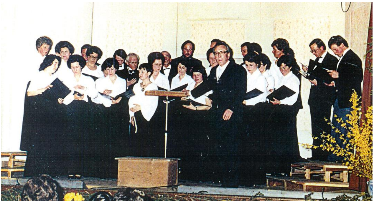
Ne pas oublier non plus l'activité très importante du Chœur-Mixte et de la Jeunesse des Charbonnières.