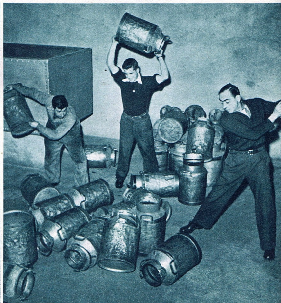
Non, ce ne sont pas des laitiers en furie... mais des « bruiteurs » qui, dans un studio de radio, procèdent à l'enregistrement du grondement d'un orage !