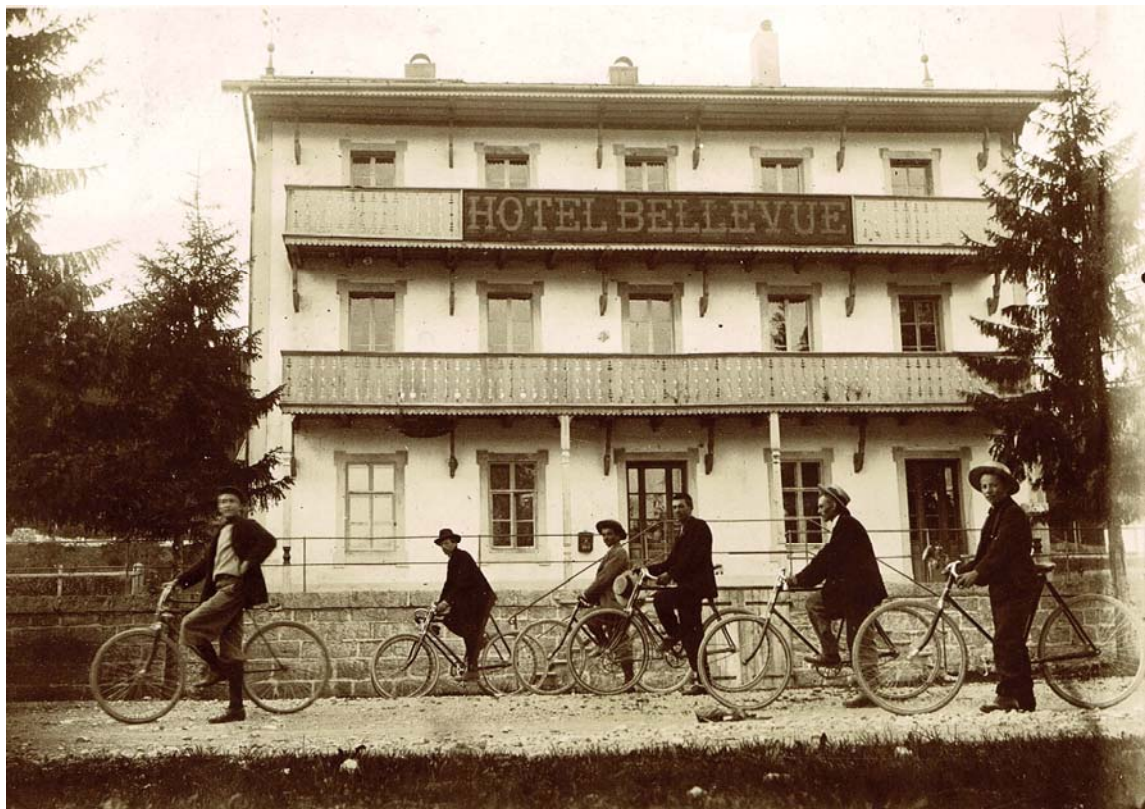
1900. 4e depuis la gauche, Eugène Dalloz. Une équipe de la gym du Brassus en ballade un dimanche. Une prise de vue faite avant la démolition du balcon supérieur et la pose des contrevents par Alfred Meylan du Progrès. Plus tard les balcons du 1 er étage furent aussi démolis et remplacés par une marquise. Texte et photo originale : Eugène Vidoudez.