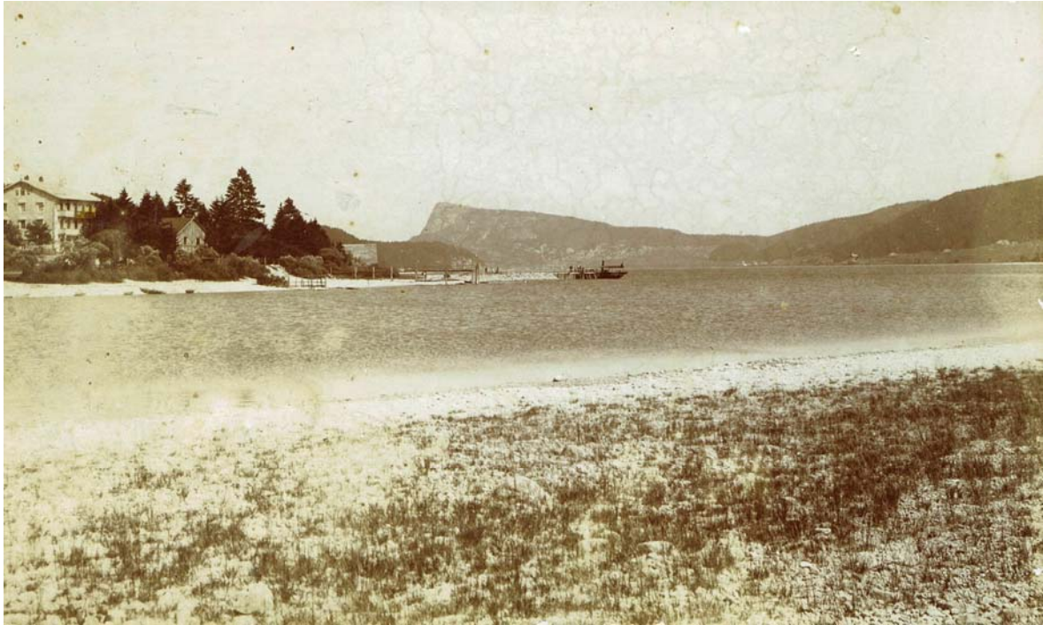
Vers 1900. L'Hôtel Bellevue du Rocheray ancien style. Le Caprice est à quai.