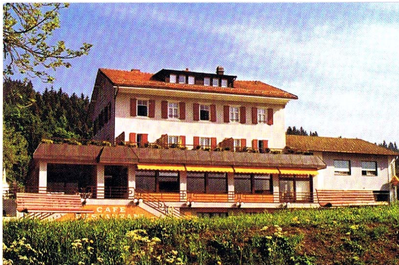
Hôtel Restaurant Bellevue Le Rocheray Lac de Joux 1347 LE SENTIER Jura - Suisse