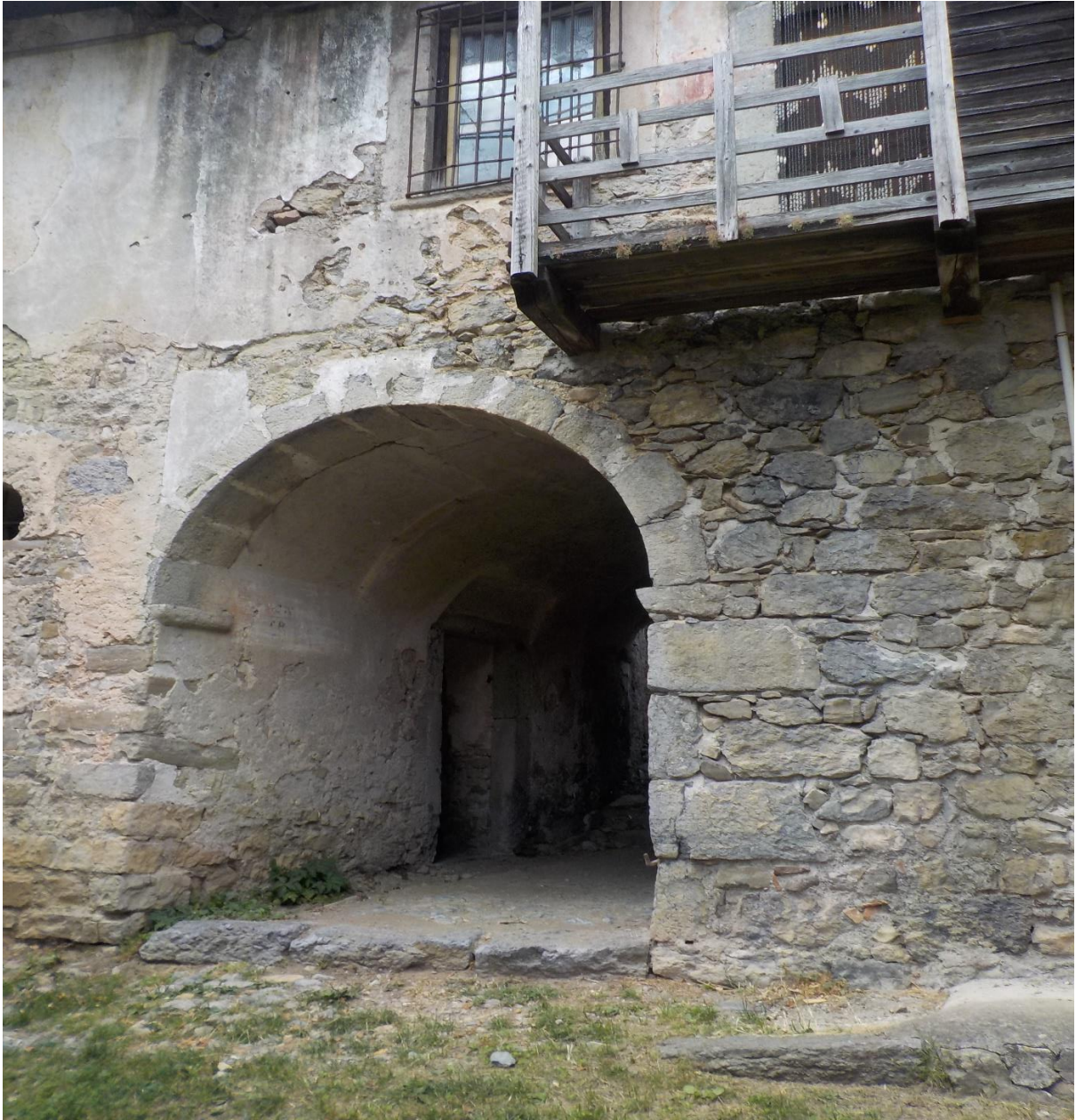
Du vieux et revieux encore à l'antique.