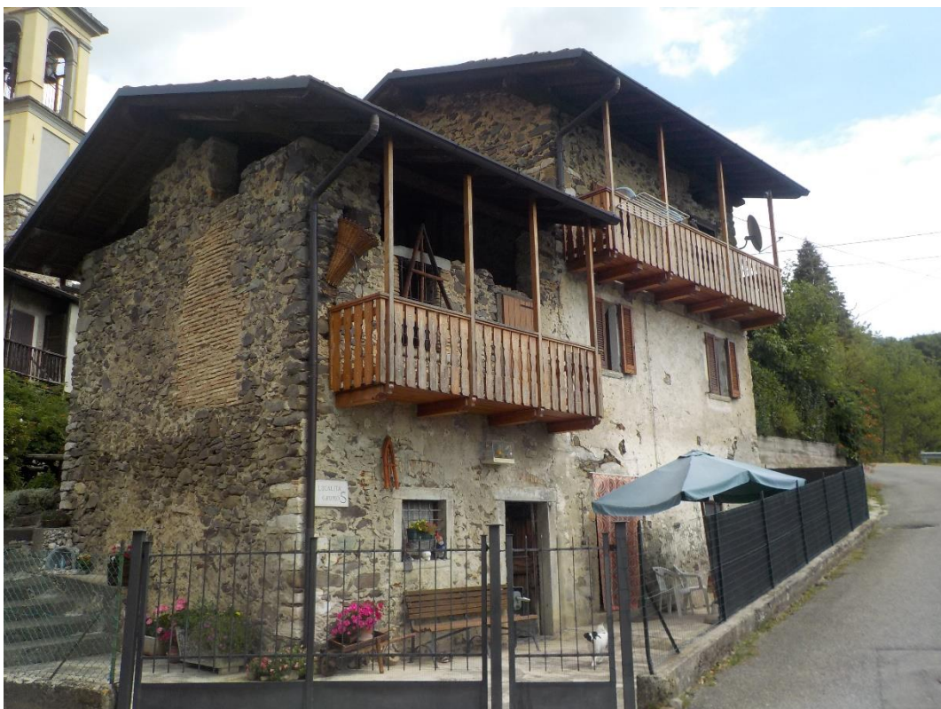
Juste au bord de la route et à l'entrée de Grumo signalé par l'enseigne de gauche.