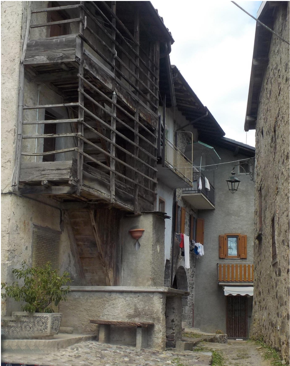
Fin de la rue et future découverte de deux belles arches.