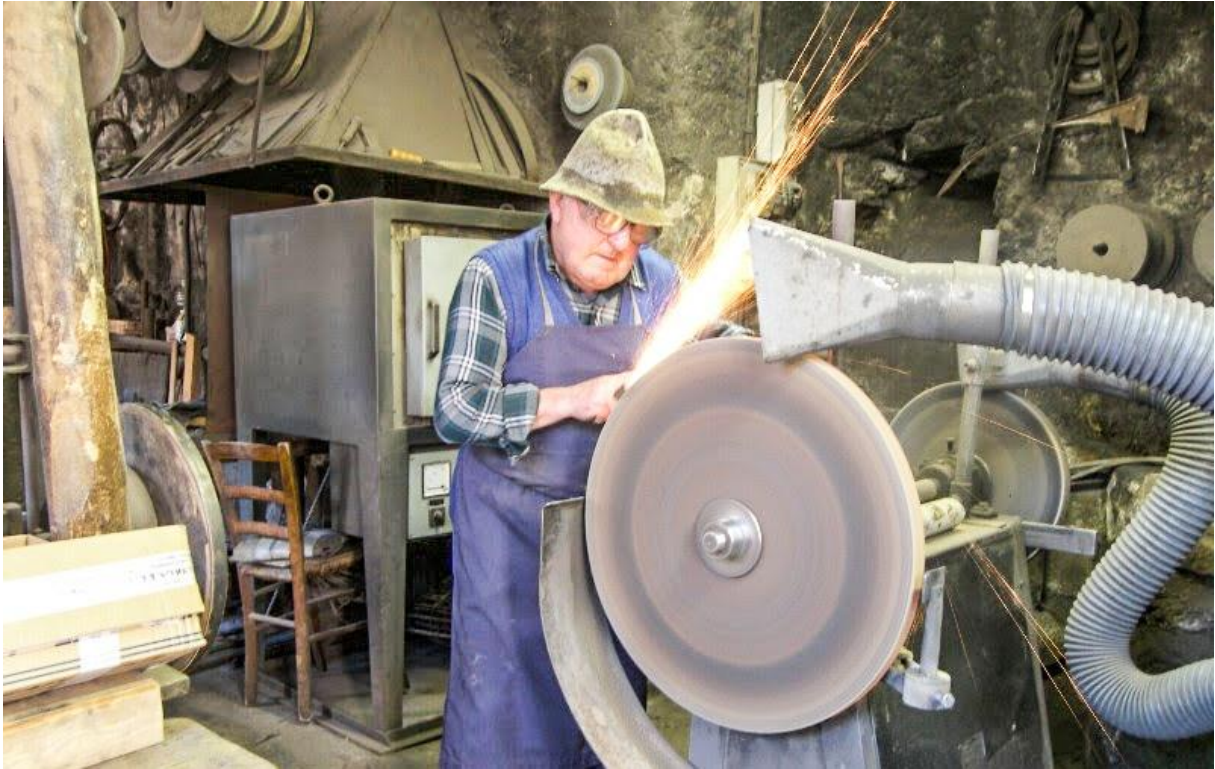
Le maître à ses œuvres.