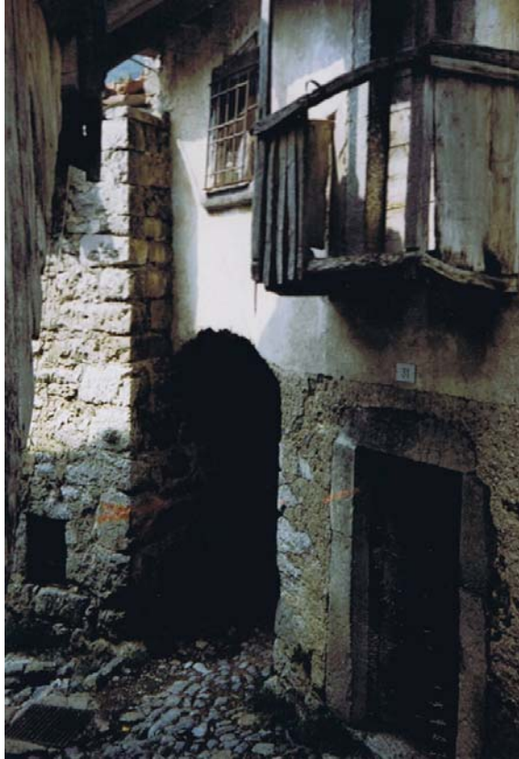
Le passage sous les maisons qui, de l'extérieur, nous fait pénétrer dans la ruelle principale du hameau.