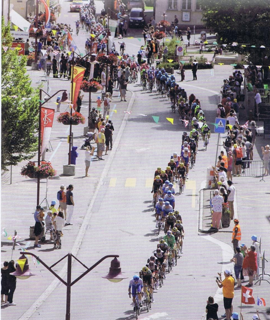
Ci-dessus, passage du peloton dans les rues du Sentier. Ci-dessous, idem à l'approche du Lieu. @A.S.O./Pauline Ballet FARJ 14 juillet 2022

Le peloton fascinera toujours. Tiens, au fait, le dopage, en nos temps modernes, ça n'existe plus ! Ce n'était donc qu'une simple affaire de mode. Une mauvaise passe, quoi !