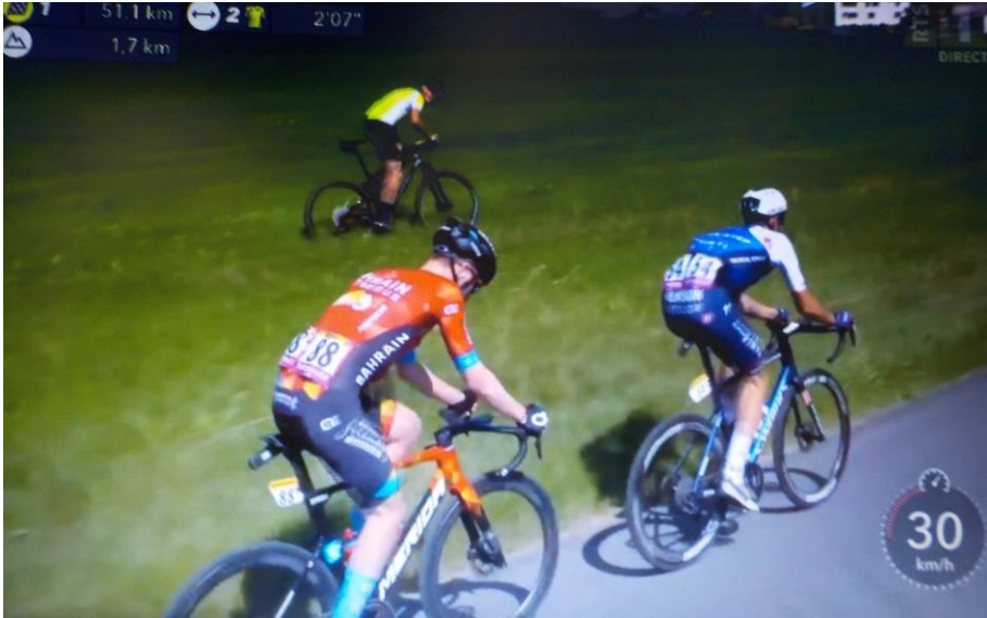
Côte du Mont-du-Lac. Un amateur tente de rivaliser et sonne le glas de notre modeste rétrospective. A la prochaine peut-être !