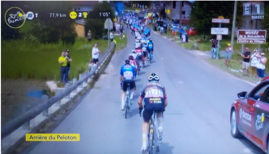
A Bois-d'Amont, le tour arrivera par la route du Vivier.