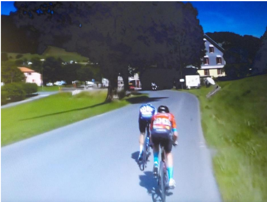
Les deux échappés arrivent en vue de ce dernier village.