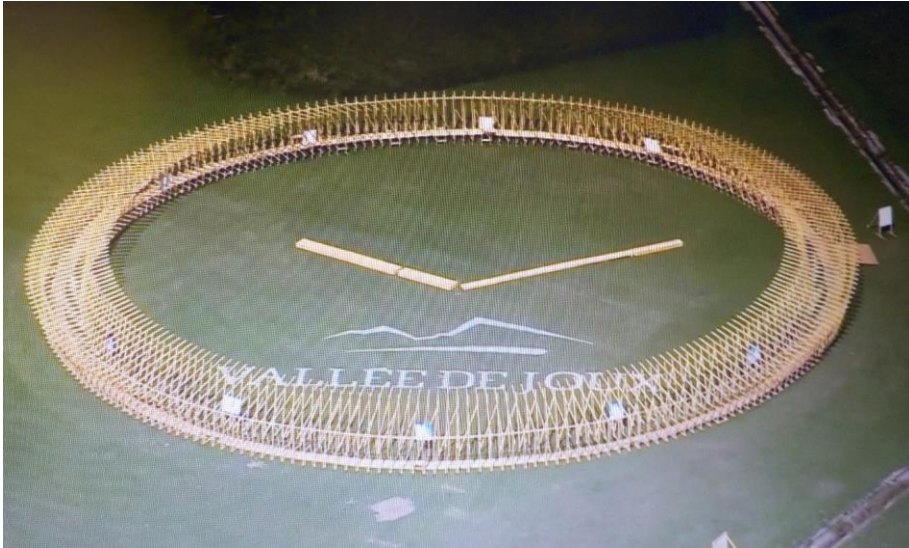
L'anneau éphémère a tout même belle allure...