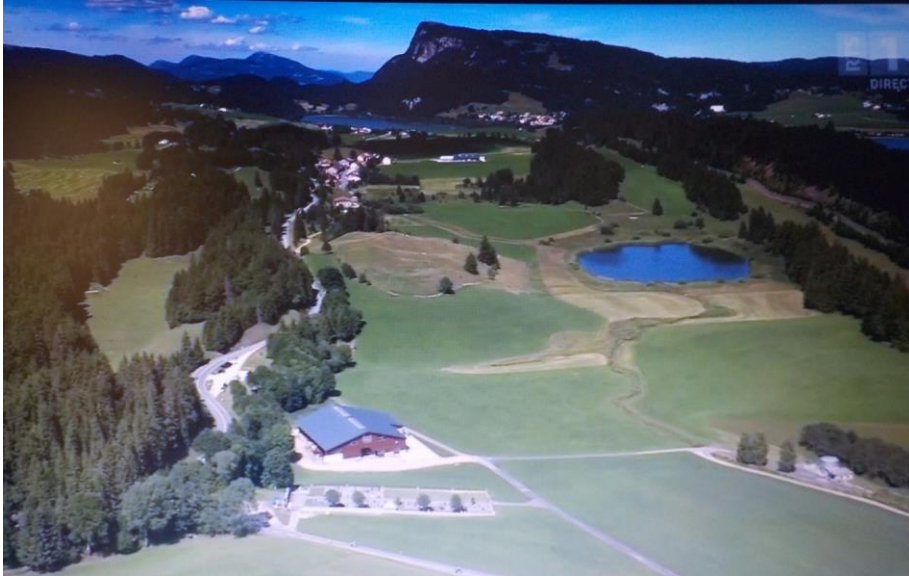
En route pour le Séchey et les Charbonnières.