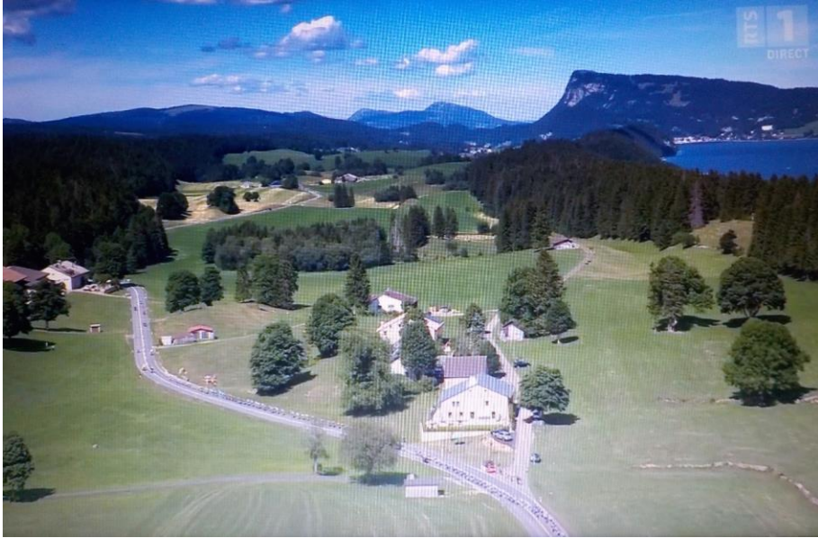
La côte du Solliat et la belle maison Dufour à la Brasserie.