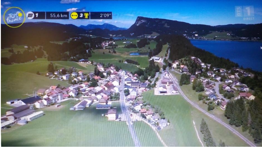
Le lieu au fil des jours...