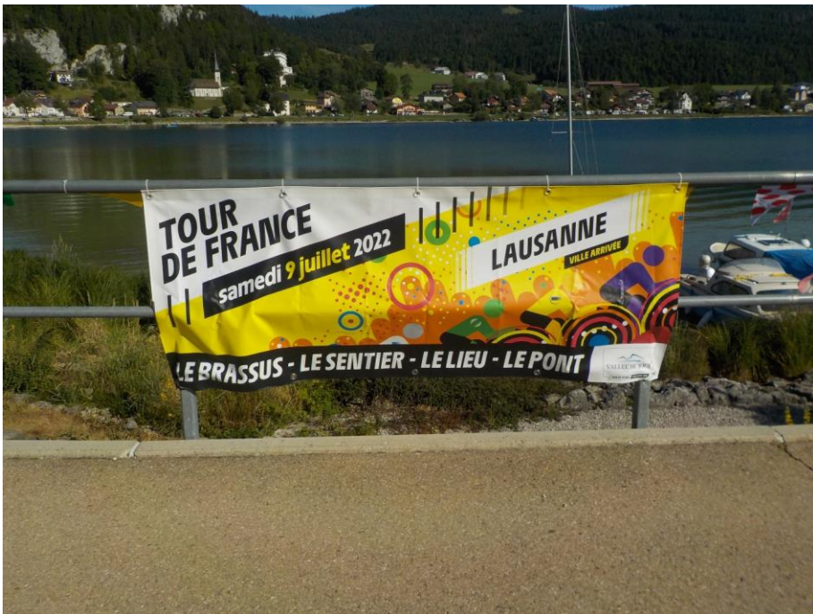
Le Pont accueille le Tour de France.