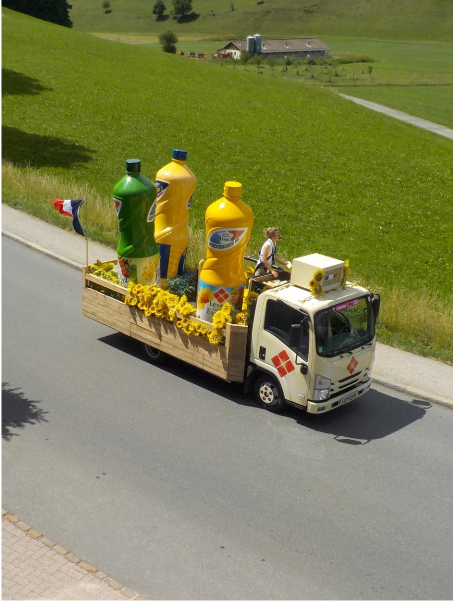
Les nénettes sont de retour !