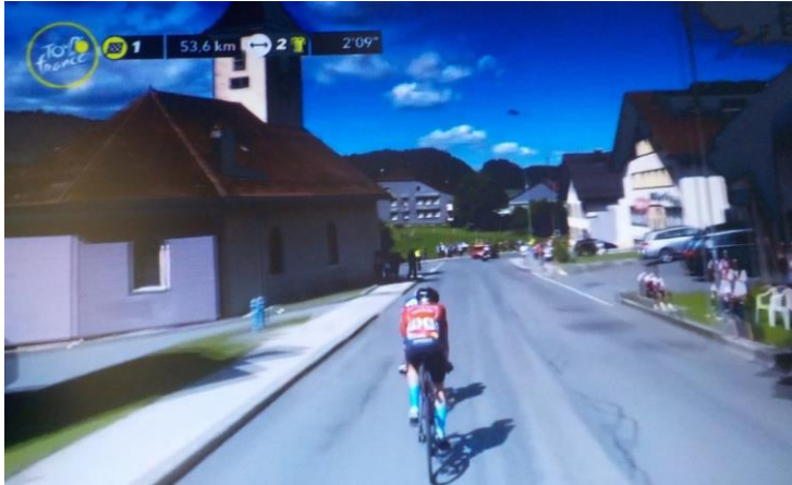
Ils passent devant l'église.