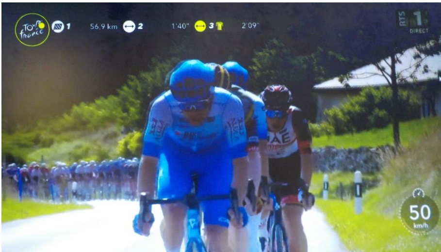
Est-ce la première fois que la Grand'Sagne voit passer le tour de France ?