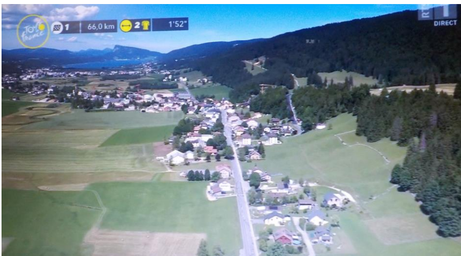
On quitte le Bas du pour arriver au Brassus.