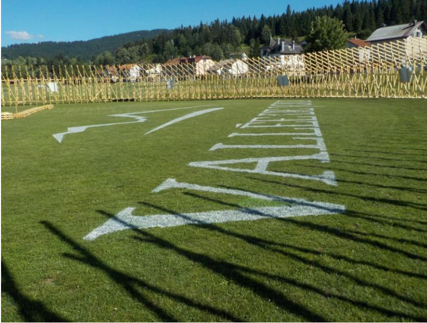
Le logo est réalisé à la dernière minute, crainte sans doute qu'il ne pleuve !