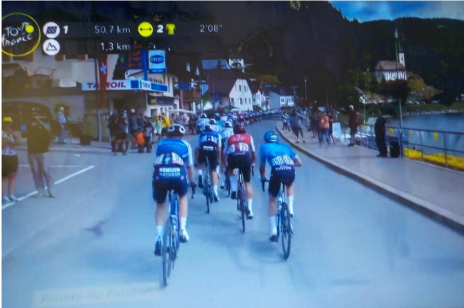
Les coureurs franchissent la rade.