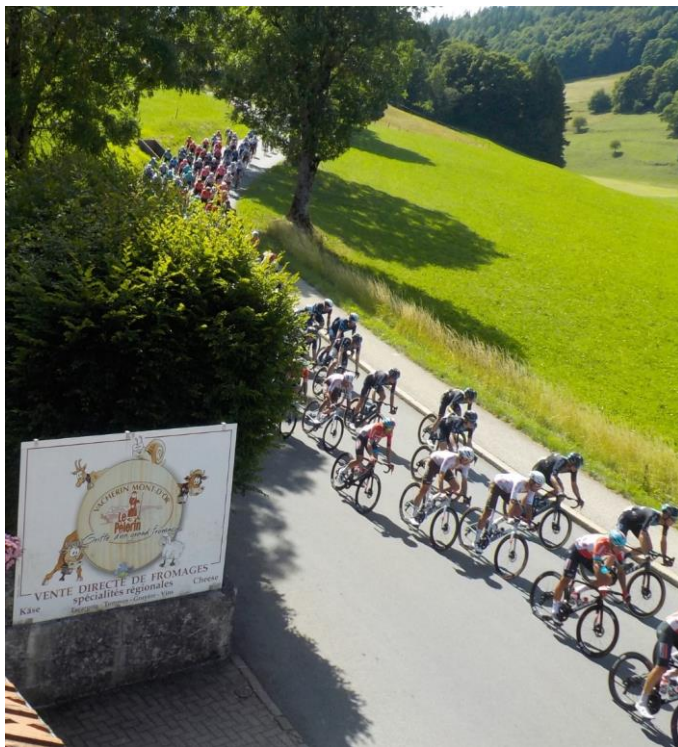
Suivis par le peloton deux minutes plus tard.